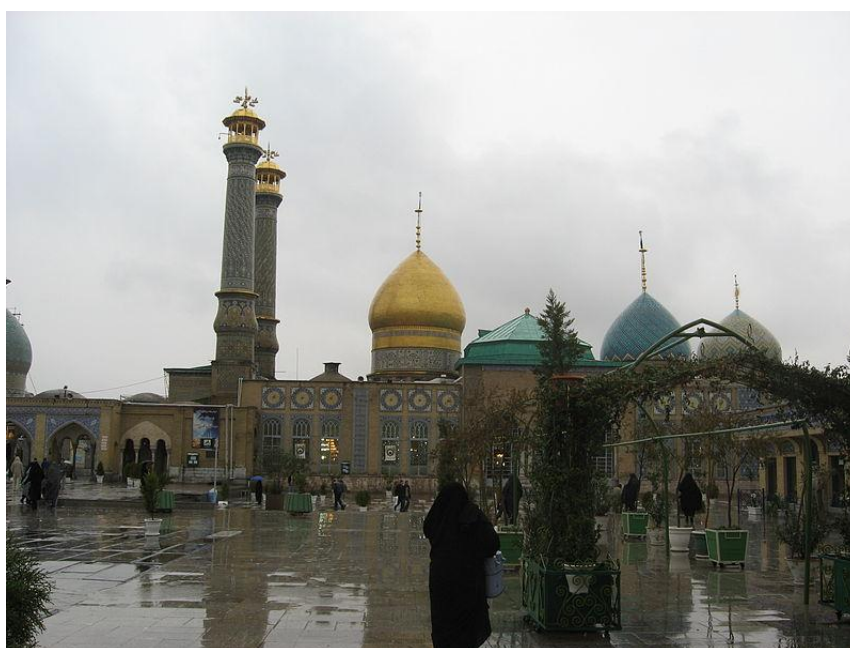
گنبد آرامگاه عبدالعظیم

جدّ سوّم عبدالعظیم، زید فرزند بزرگ امام حسن است. ایشان سرپرست اوقاف پیامبر اسلام بوده و به بزرگواری، پرهیزکاری و نیکوکاری توصیف گردیده است. شاعران، او را ستوده و مردم از هر سو به وی روی می آورده‌اند. وی در یکصد سالگی، چشم از جهان فرو بست و در زمینی به نام «حاجز» در نزدیکی مدینه دفن گردید.