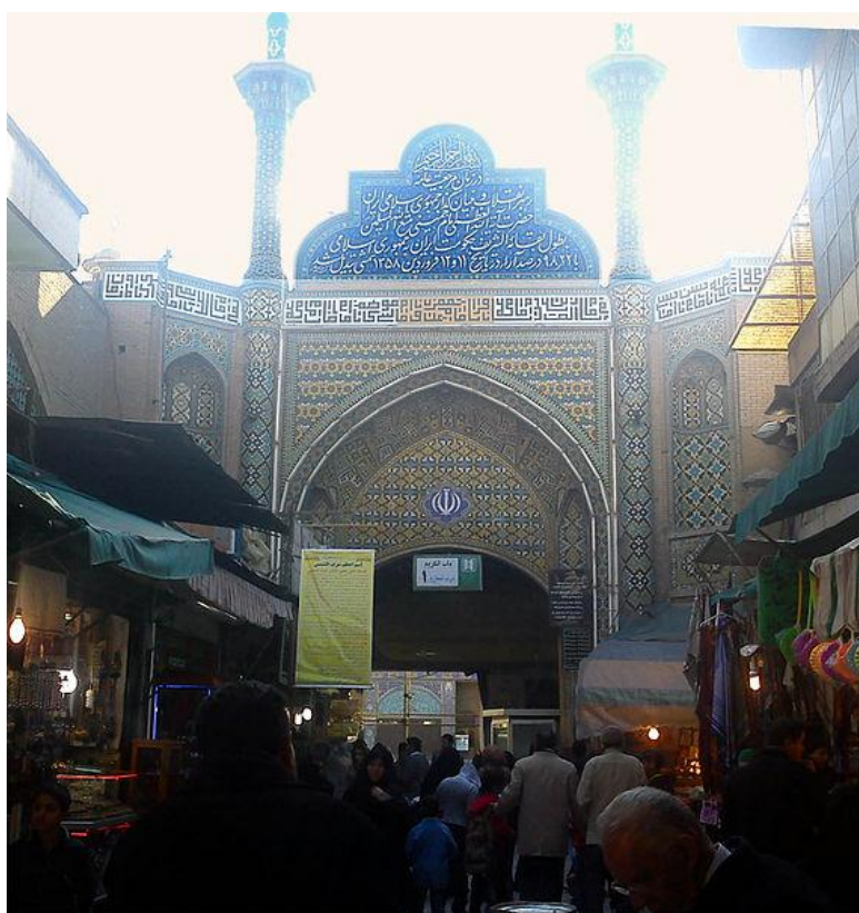
سردر آرامگاه در زمان کنونی با نشان زمان و شمار آرا رفراندوم جمهوری اسلامی

تاریخ ساخت درب بزرگ چوبی بین رواق شمالی و مسجد زنانه ۹۰۴ هجری قمری (برابر با ۱۴۹۸ میلادی) و به سبک دوره تیموری است.